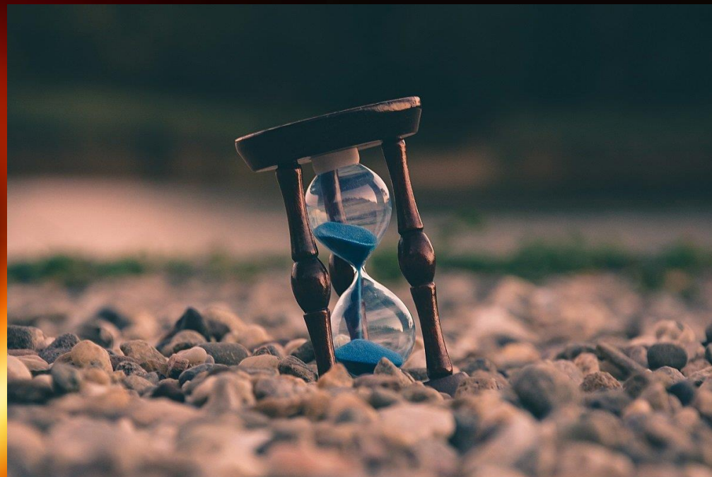
SPRECO DI TEMPO