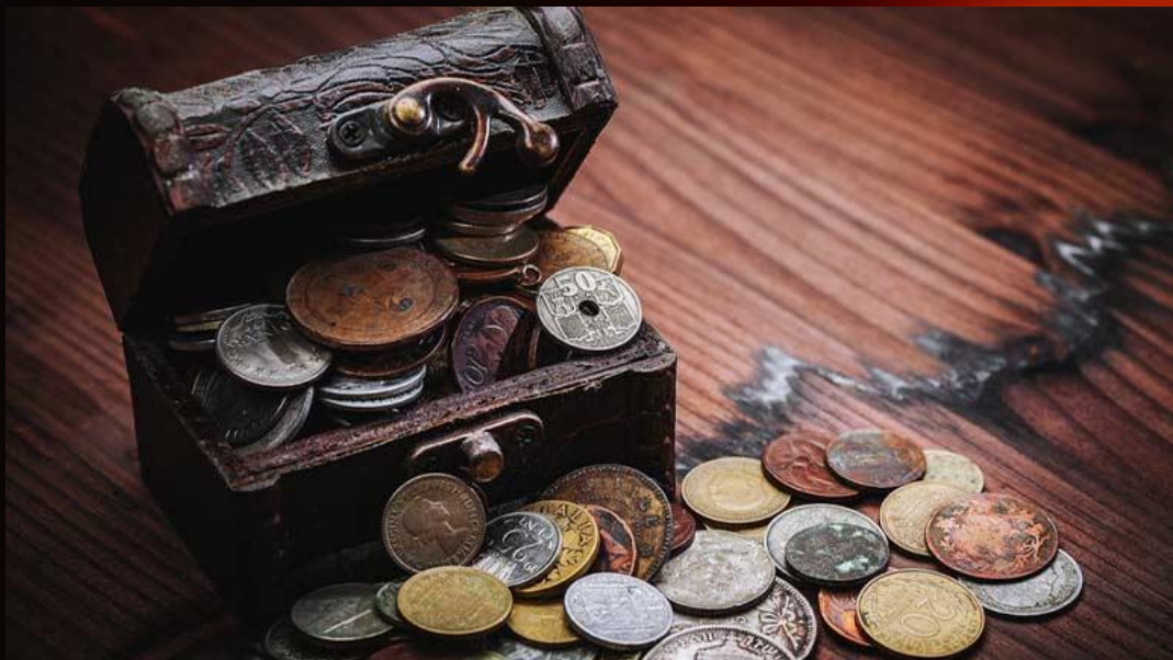
SPRECO DI DENARO